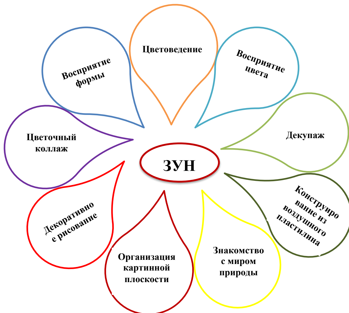
Схема модульного структурирования дополнительной общеразвивающей программы «Творчество без границ»